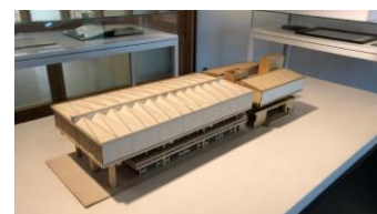
旧県立博物館模型