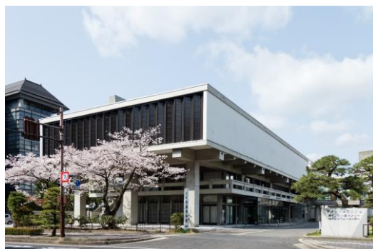
旧島根県立博物館（菊竹清訓）S33年