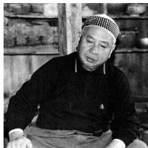
第23代田部長右衛門