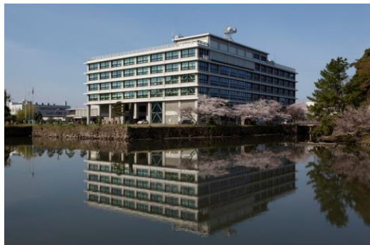
島根県庁舎本庁舎（安田臣）S34年