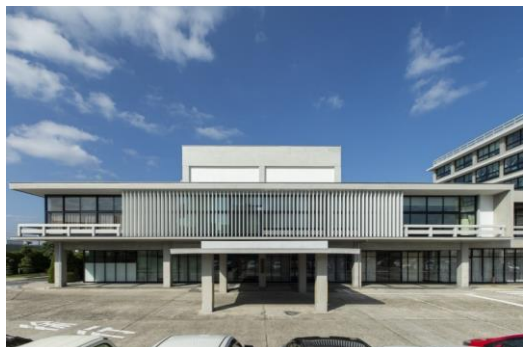
島根県庁舎議事堂（安田臣）S34年