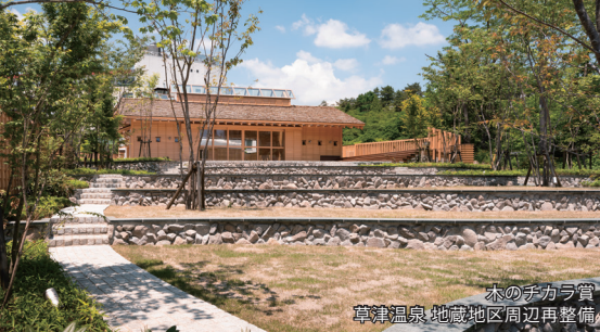
木のチカラ賞 草津温泉 地蔵地区周辺再整備