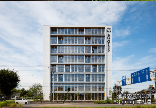
選考委員特別賞 AQ group 本社屋