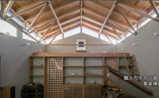
職人のチカラ賞 奏楽棟