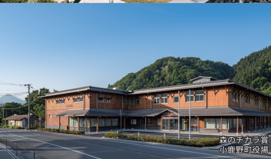
森のチカラ賞 小鹿野町役場