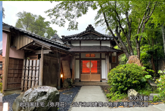
木の活動賞 岩月家住宅（弥月荘）～近代和風建築の修理・整備と活用～