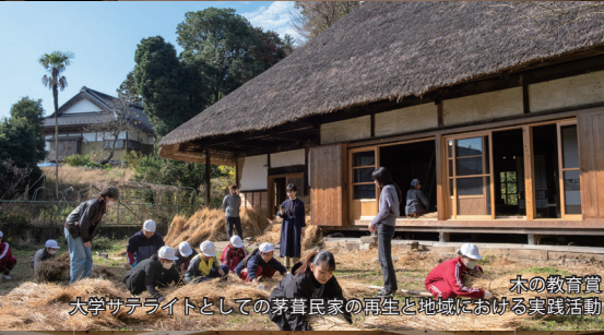
木の教育賞 大学サテライトとしての茅草民家の再生と地域における実践活動