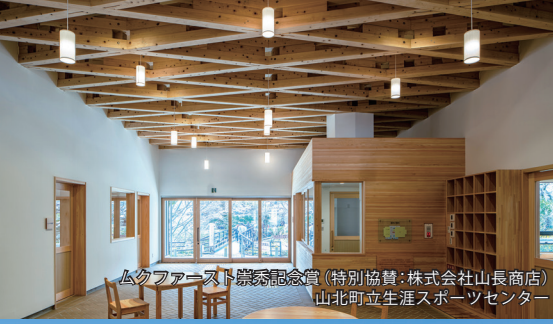
ムクファースト建築記念賞(特別協賛:株式会社山長商店) 山北町立生涯スポーツセンター