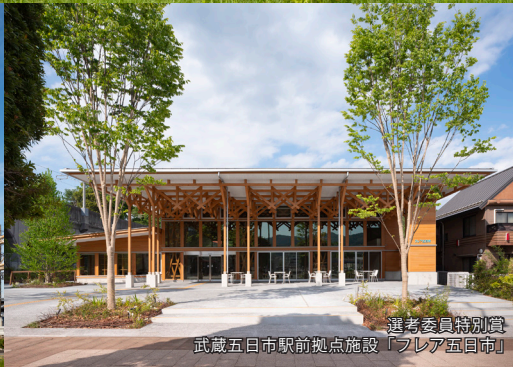
選考委員特別賞 武蔵五日市駅前拠点施設「フレア五日市」