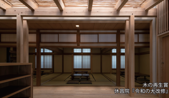
木の再生賞 休昌院『令和の大改修』